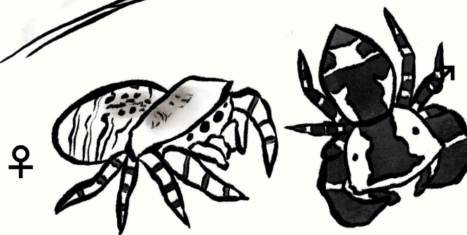
♀ Beige Beetle Jumper 黃寬胸蠅虎