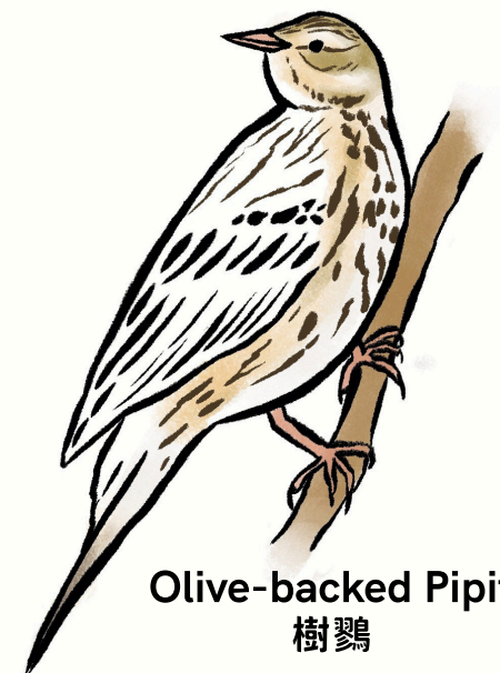
Olive-backed Pipit 樹鷓